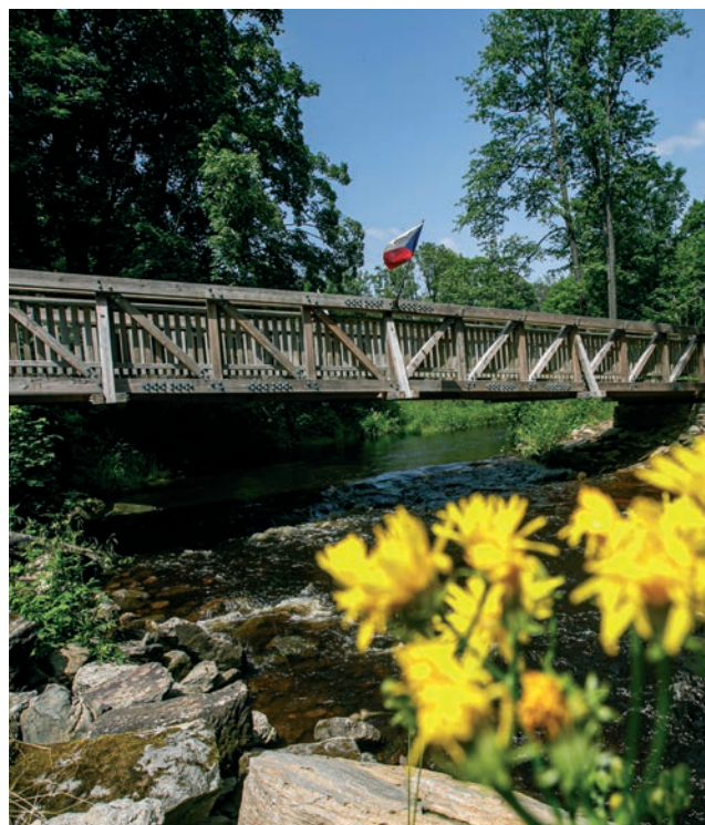
Most w Neratovie, który łączy czeski i polski brzeg rzeki Divoká Orlice.